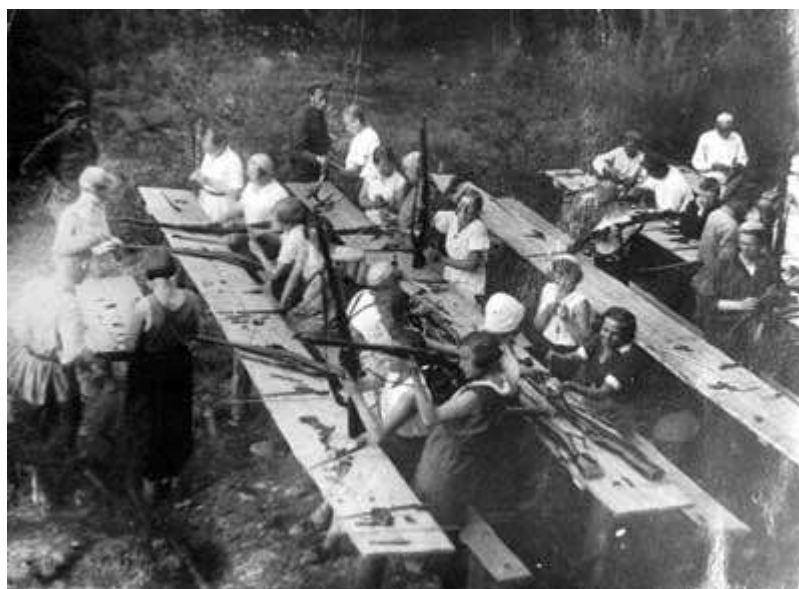
Лагерь Осоавиахима. Занятия с винтовками